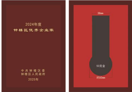
尺寸：140X200mm 仿红木盒，盒面激光刻字描金 枣红色天地 盖不烫字