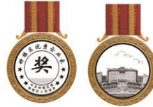
直径：50mm 纯金：100克 铜圈外径60mm