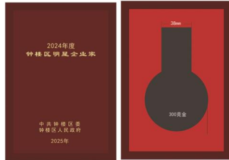
尺寸：140X200mm 仿红木盒，盒面激光刻字描金 枣红色天地 盖不烫字