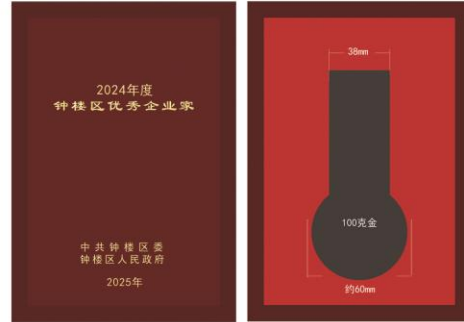
尺寸：140X200mm 仿红木盒，盒面激光刻字描金 枣红色天地 盖不烫字