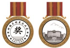
直径：55mm 纯金：150克 铜圈外径：65mm