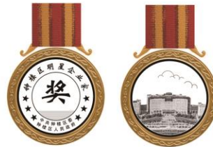
直径：70mm 纯金：300克 铜圈外径：80mm