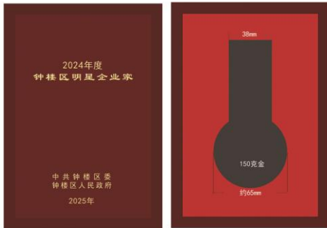
尺寸：140X200mm 仿红木盒，盒面激光刻字描金 枣红色天地 盖不烫字